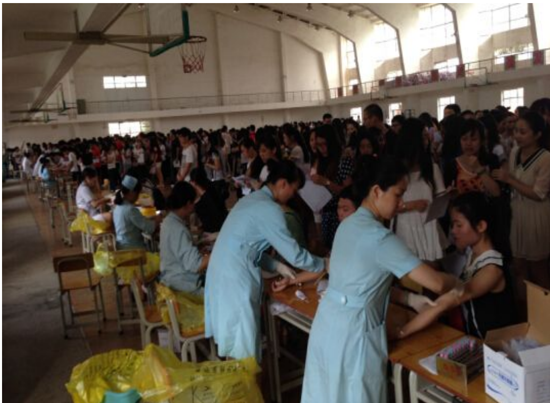
图1 医护人员在给学生们体检

教师资格申报工作是一项细致的工作，其申报流程涉及指导学生填表、收集学生申报材料、查找学生录取名册、现场确认、专家审核等 15 个步骤，组织体检只是教师资格申报工作的其中一个环节。