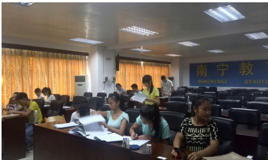
图2 学生们在整理材料、抄证书编号、贴照片