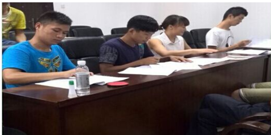
图3 学生们在两位教育局工作人员的监督下盖公章